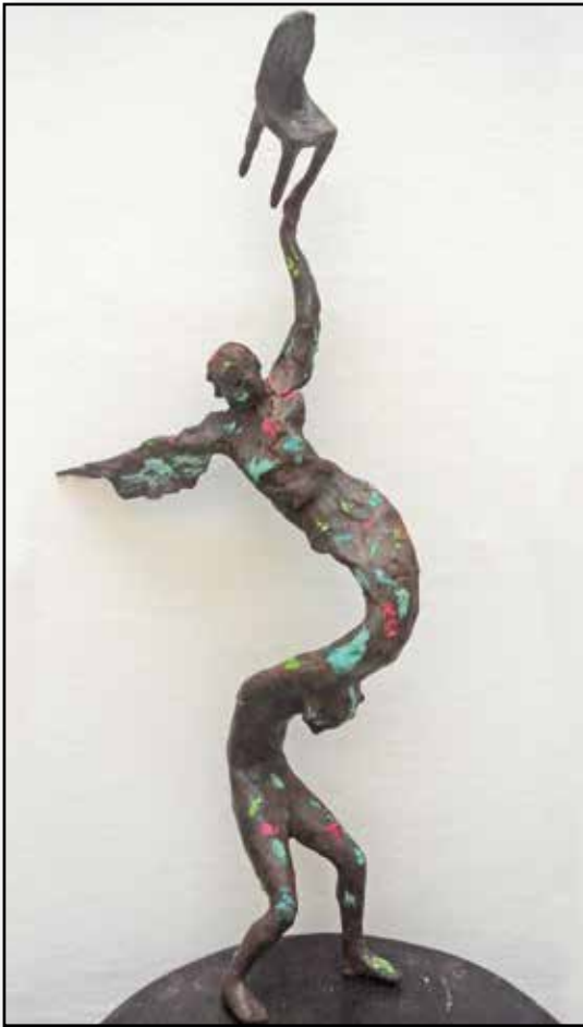
Cavina - Cera Leggera