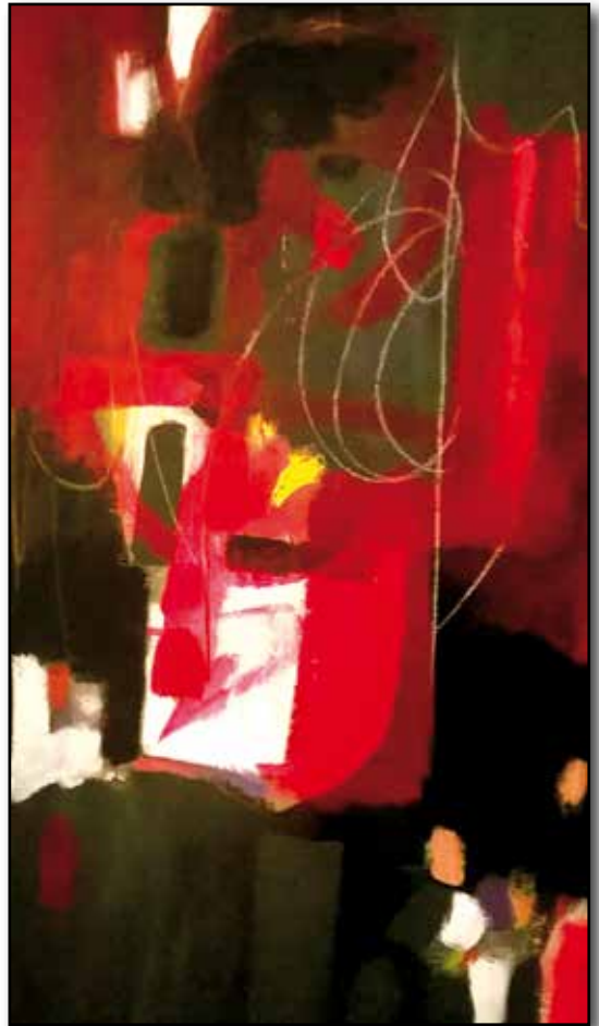
Natale De Luca - Viaggio nel rosso